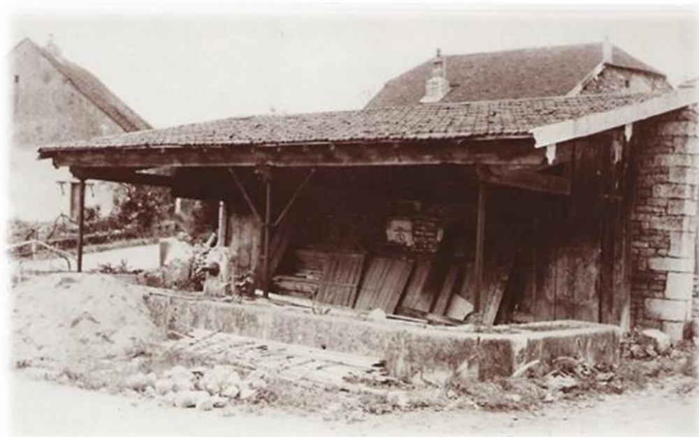
FONTAINE DE REVEURE OU FONTAINE DITE DU BAS EMPLACEMENT ACTUEL DES ATELIERS DE DISTILLATION ET DE PASTEURISATION